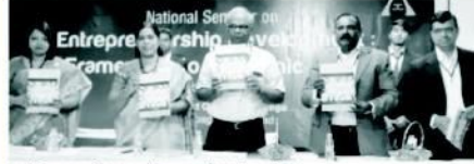
సావనీరు అవతం వేష్యులను సెమినార్ యూనివర్సిటీ డైరెక్టర్ ప్రాఫెసర్